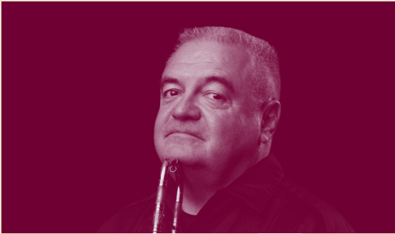
DANIEL LASSALLE sacqueboute

Daniel Lassalle a acquis une réputation internationale de premier plan, à la fois comme tromboniste et comme joueur de sacqueboute, deux instruments qu'il pratique avec une virtuosité et une musicalité rares.